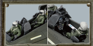
· 飞行员及驾驶舱细节