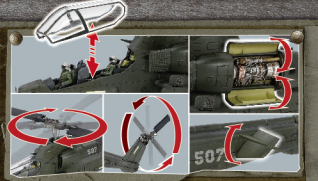
· 活动部份包括螺旋桨，驾驶舱挡风玻璃，发动机舱门和升降舵