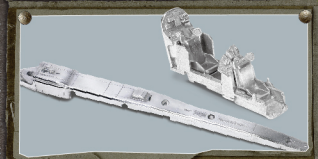
· 部份结构使用合金物料