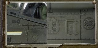
· 极致考证-根据真实还原的移印位置