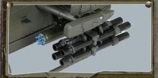
· 模型级的武器装备: M260, M261 火箭发射器，拖式导弹和AIM-9响尾蛇导弹