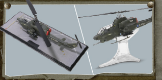
· 停机坪底座或飞行状态展示台