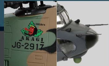
• 丰富的表面细节和FOV独特的轻微旧化效果