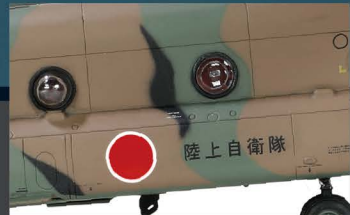
• 考证资料来自真实直升机