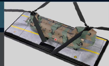
• 展示底座图案按真实停机坪描绘