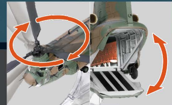
• 可转动的螺旋桨和开关的后门舷梯