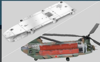
• 机身部分使用合金制成和细致的全内结构(包括驾驶舱, 飞行员和机舱)