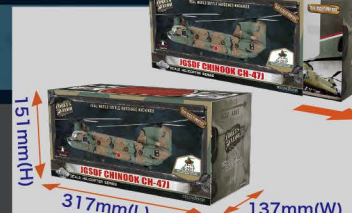
• 精美及标准寸的FOV直升机系列包装