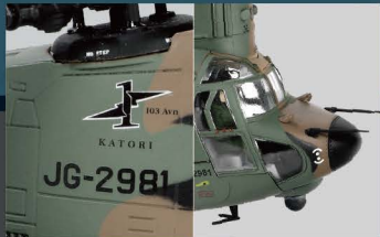
• 丰富的表面细节和FOV独特的轻微旧化效果