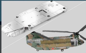
• 机身部分使用合金制成和细致的全内结构 (包括驾驶舱, 飞行员和机舱)

早于二次大战结束后, 五零年代的初期美国航空制造商波音公司已经与日本航空工业的多家制造商开始了合作关系, 由最初三菱重工获得了战斗机F-86军刀的生产授权, 到50年代末Vetrol与川崎重工(简称为KHI)签定了合作协议允许KHI授权生产V-107, 后来海骑士直升机更成为了日本自卫队和其他地面部队的其中一款主力型号。在Vetrol与KHI签定了协议的半年后, 美国波音公司收购了Vetrol, 并把原来的部门改名为波音Vetrol。到了1984年, 由于海骑士机队日渐老化的原因, KHI便开始获得授权生产在越战时期大获好评的奇诺克CH-47系列直升机, 机身的主要龙骨部份是交由KHI在岐阜的工厂制造, 由于这款直升机并非在美国进口, 所以在机型编号CH-47的后边是加入了英文字母“J”以作识别, 一般称之为CH-47J。