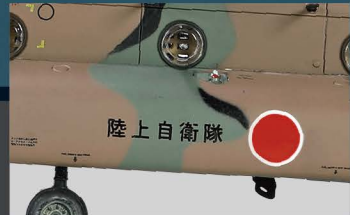
• 考证资料来自真实直升机