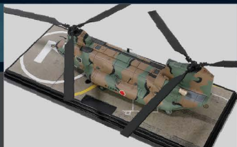
• 展示底座图案按真实停机坪描绘