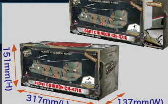
• 精美及标准寸的FOV直升机系列包装