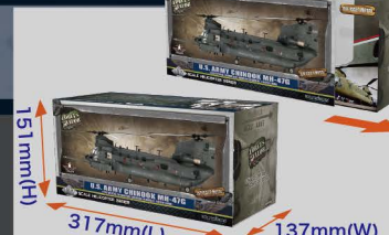
• 精美及标准寸的FOV直升机系列包装