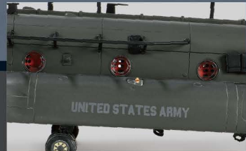
• 考证资料来自真实直升机