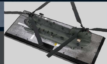
• 展示底座图案按真实停机坪描绘