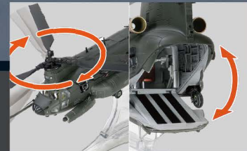
• 可转动的螺旋桨和开关的后门舷梯