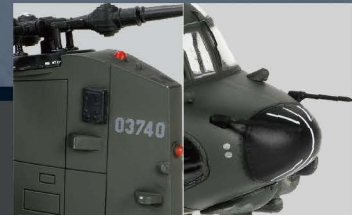
• 丰富的表面细节和FOV独特的轻微旧化效果